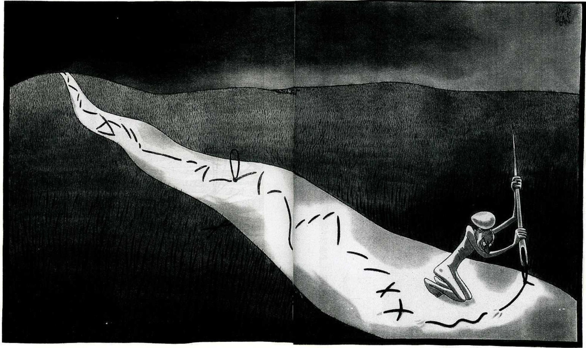
Experience, Abner Dean, 1945