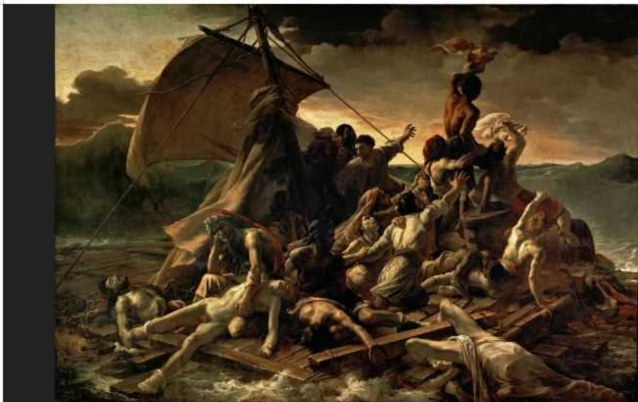
Le radeau de la Méduse, Eugène Delacroix 1818, une vision du future état de l'Occident en 2022